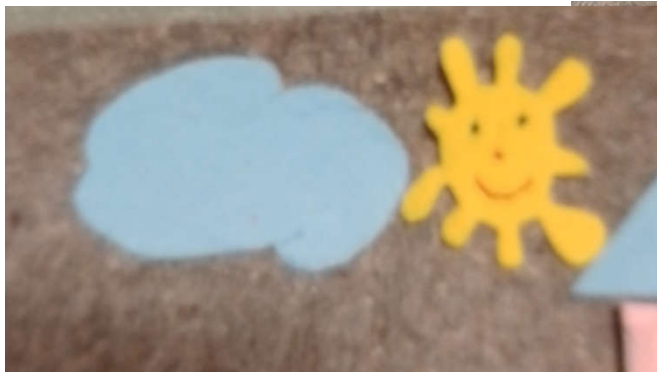
Справа от тучки